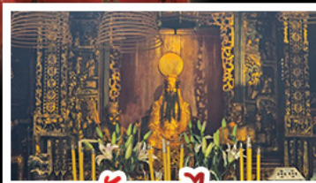
วัดกวนหนี่ท