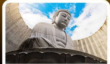
เนินเขาแห่งพระพุทธรเจ้า