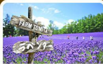
โทมิตะฟาร์ม