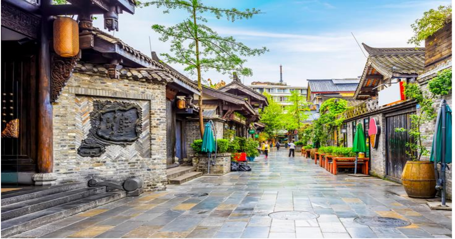
กลางวัน รับประทานอาหารกลางวัน ณ ภัตตาคาร (เมื่อที่ 11)

จากนั้นนำท่านเที่ยวชม ถนนโบราณชอยกว้างชอยแคบ + POP MART จัดว่ามีเสน่ห์ของความเป็น อาคาร ตกแต่งด้วยเรื่องราววิถีชีวิตการเป็นอยู่ของคนจีนเฉิงตูในสมัยโบราณ แต่ผสมความทันสมัยใส่ เข้าไปได้อย่างลงตัว ถนนคนเดินมี 3 ซอย แต่ละซอยมีความยาวประมาณ 400 เมตร มีร้านค้าเล็กๆ ตั้งเรียงรายอยู่ในแต่ละซอยและตรอกให้เดินช้อปปิ้งเพลิน ทั้งร้านหนังสือ ร้านชา-กาแฟ บาร์ เสื้อผ้า ไปจนถึงร้านอาหารนานาชาติ รวมร้านค้าทุกซอยแล้วมีจำนวนหลายร้อยร้านค้า