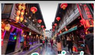
ถนนโบราณจินหลี่