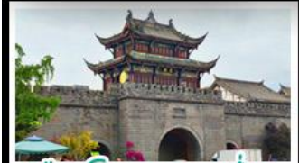
เมืองโบราณทวนเซี่ยน

ภูเขาสี่ดรุณี - อุทยานปู้ผิงโกว - สะพานหมานเฉียว - ร้านหนังสือจงซูเก๋อ - เมืองโบราณกวนเสี้ยน จตุรัสหยางเกียนหวู่ - หมีแพนด้าเซสพี - ถนนโบราณชอยกวางชอยแคบ - ถนนคนเดินไท่กู๋หลี่ ถนนคนเดินซุนซี - ถนนโบราณจินหลี่ - แพนด้ายักษ์ปิ่นตัก - น้ำพุไม้ไผ่ตักSKP - วัดต้าอ้อ