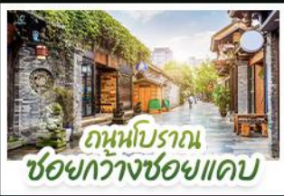
ถนนโบราณ ชอยกวางชอยแคบ