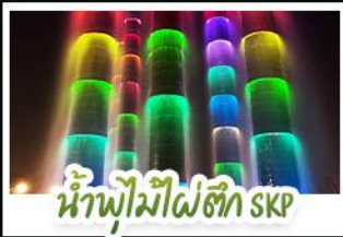
น้ำพุไม้ไผ่ตึก SKP

ภูเขาสี่ดรุณี • อุทยานหวงหลง • เมืองโบราณชงพาน • ทะเลสาบเต๋อซี อุทยานจิวจ้ายโกว • จัตุรัสหย่างเทียนหู่ • รูปปั้นหมีแพนด้าเซลฟี่ ถนนโบราณชอยกวางชอยแคบ • ถนนคนเดินไท่กุ่หลี่ • ถนนคนเดินซุนซี แพนด้ายักษ์ปิ่นตึก ณ ตึก IFS • วัดต้าฉีฉือ • น้ำพุไม้ไผ่ตึก SKP