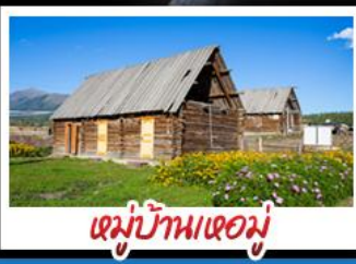
หมู่บ้านหอมู่