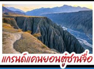
แกรนด์แคนยอนตุ่ซ่านจื่อ