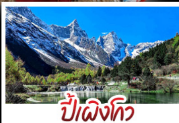
ปี่ผิงโกว