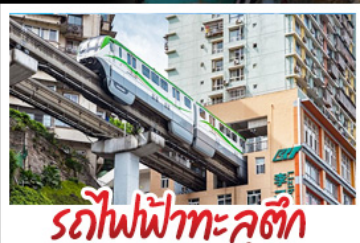
รถไฟฟ้าทะเลสาบ