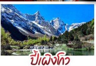
ปี้เฉิงโกว