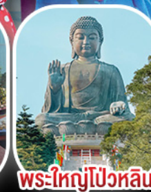
พระใหญ่โป้วหลิน