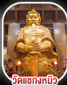
วัดเข่งหมิว