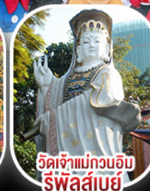
วัดเจ้าแม่กวนอิม รีพัลส์เบย์