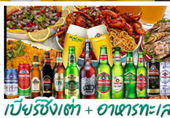
เบียร์ซิงคโปร์ + อาหารทะเล