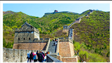
กำแพงเมืองจีนด่านจวิยงกวน