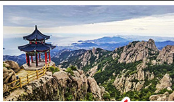
ภูเขาเลาซาน