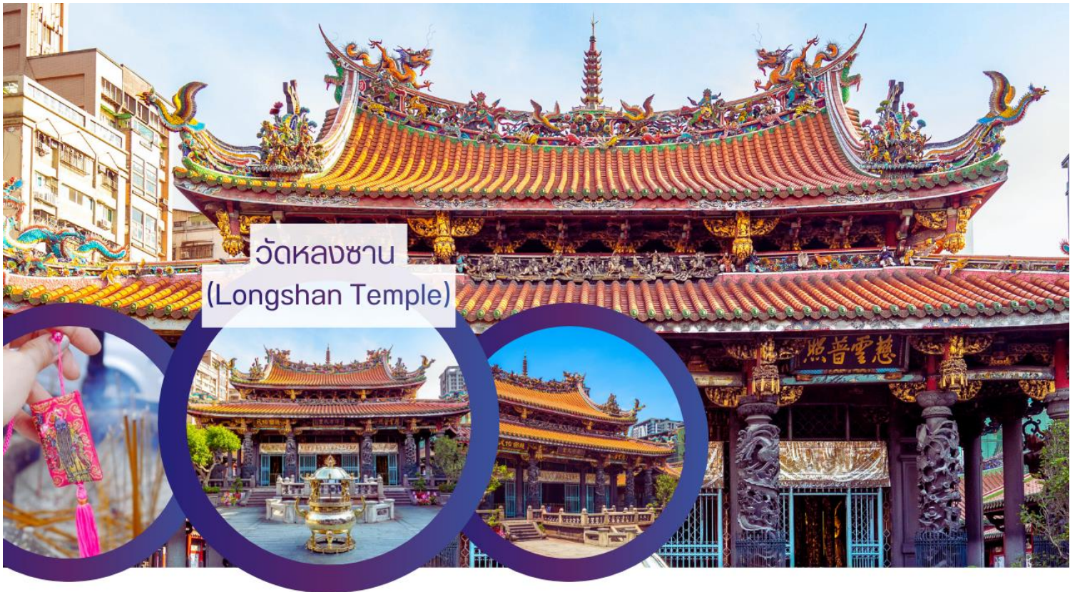
วัดหลงซาน (Longshan Temple)

ปิดท้ายค่ำคืนด้วยเดินเล่น ย่านซีเหมินติง (Ximending) เป็นย่านช้อปปิ้งและแหล่งบันเทิงยอดนิยมที่ตั้งอยู่ในเขตว่านฮวา นครไทเป ประเทศไต้หวัน ได้รับฉายาว่า "ฮาราจุกุแห่งไทเป" เนื่องจากเป็นศูนย์กลางแฟชั่นและวัฒนธรรมสมัยใหม่ของวัยรุ่นไต้หวัน