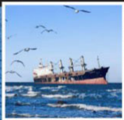
เรือลู่ เวย์ส