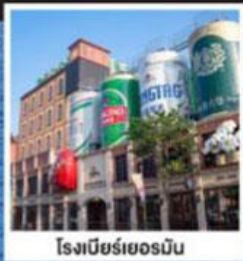
โรงเบียร์เยอรมัน