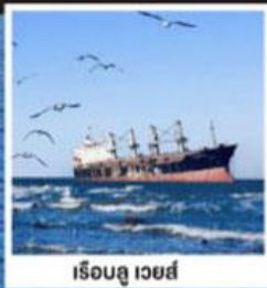
เรือลู่เว่ยส