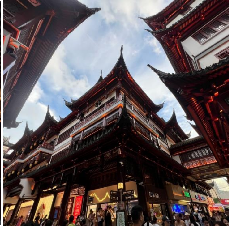
กลางวัน รับประทานอาหารกลางวัน ณ ภัตตาคาร (มือที่ 2)