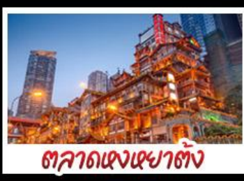
ศาลาแดงเซาตั้ง