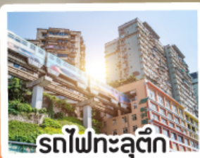
รถไฟฟ้าทะลุติ๊ก