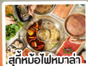
สุกี้หม้อไฟหม่าล่า