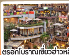
ตรอกโบราณเขี้ยวฮ่าวหลี่