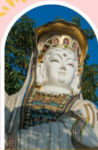
รีพลัสเบย์