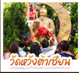
วัดเข่งต้าเซียน