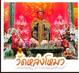
วัดเล่งโง้ว

นั่งรถรางฟ้าแถมสู่ TOP OF PEAK • ซ้อมปังจุใจมงก๊ก และ CITYGATE OUTLAETS • นั่งกระเช้ามองปิง สักการะพระใหญ่เทียนถาน • จอพรเจ้าแม่หล่งโหมว แม่ทอง 5 มังกร ให้ประสบความสำเร็จในทุกๆ ด้าน