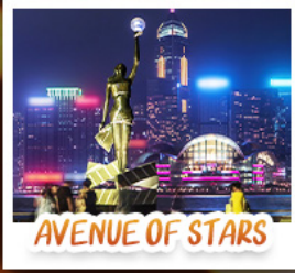
AVENUE OF STARS