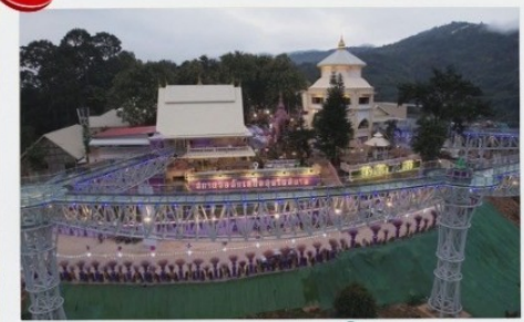
สกายวอล์ค

2 ท่านขึ้นไป 14,499 บาท/ท่าน 4 ท่านขึ้นไป 12,799 บาท/ท่าน 6 ท่านขึ้นไป