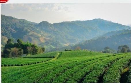
ดอยแม่สลอง