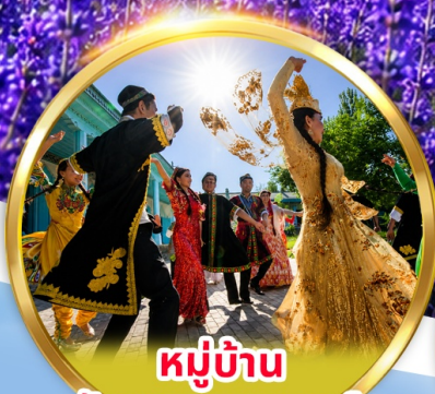
หมู่บ้าน วัฒนธรรมอูยกูร์