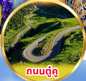
ถนนตุ๋นคู