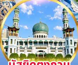
มัสยิดตงกวน