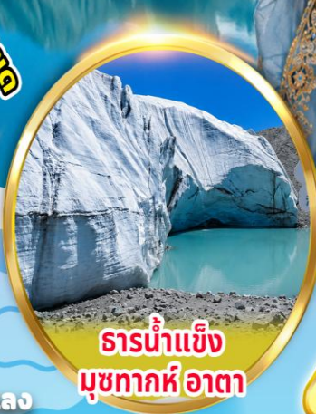
ธารน้ำแข็ง มุขทากห์อาตา