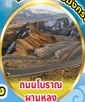
ถนนโบราณ ผานหลง