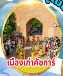
เมืองเก่าคัชการ์