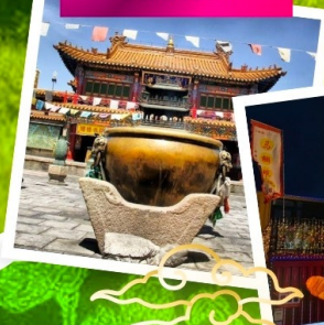
ถนนคนเดินคังบาร์ซี