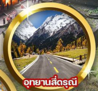
อุทยานสี่ดรุณี