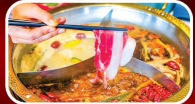
ชาบูหมาล่า