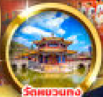
วัดหลวมทง