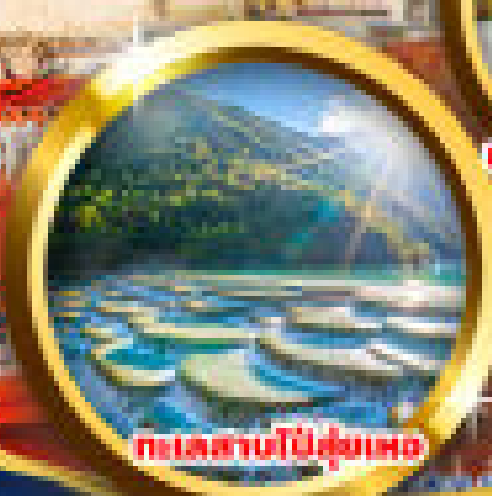
ทะเลสาบป๋าย่ฝูเหมอ