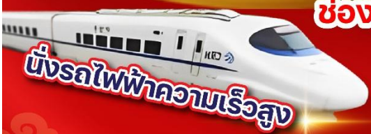
บั้งรถไฟฟ้าความเร็วสูง