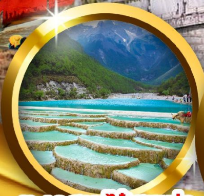
ทะเลสาบไ้สวยเห่อ