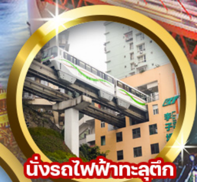
นั่งรถไฟฟ้าทะลุтик