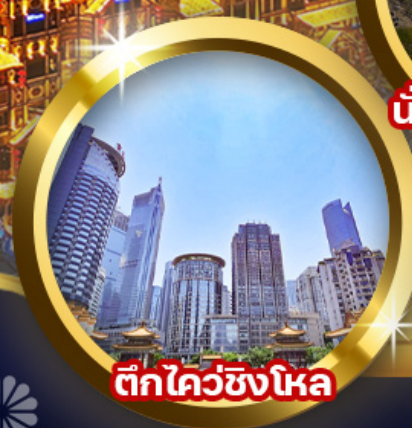
ตึกไควซิงโหล