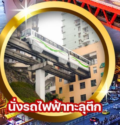
นั่งรถไฟฟ้าทะเลตุ๊ก