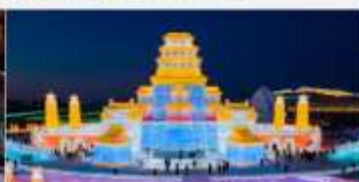
เทศกาลคอมไฟน้ำแข็ง