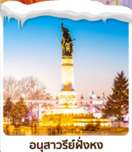
อนุสาวรีย์ต่งหง