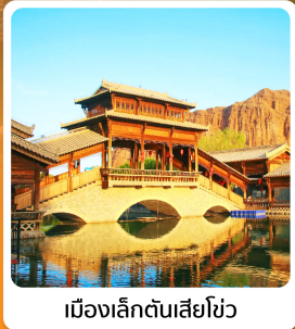
เมืองเล็กตันเสี่ยโข่ว

อาหารมื้อพิเศษ ไก่ตุ๋นหม้อไอน้ำ ซีโครงหม้อสุไต้ถ่านใจ