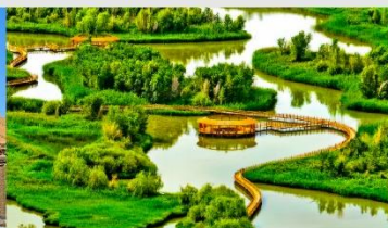
อุทยานพื้นที่ชุ่มน้ำจางเย่