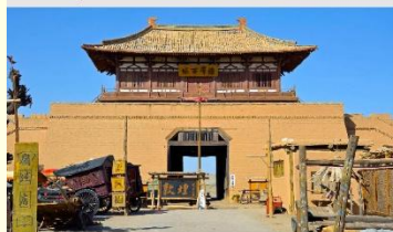
เมืองโบราณตุนหวง