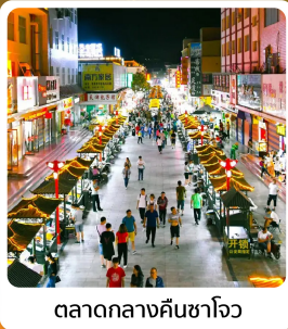
ตลาดกลางคิ่นซาโจว