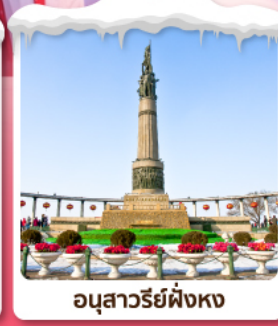
อนุสาวรีย์ผิงหง