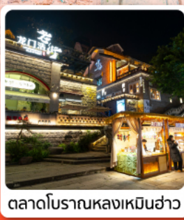
ตลาดโบราณหลงเหมินฮ่าว

ไฮไลท์ อุทยานเขานางฟ้า อุทยานแห่งชาติหลุมฟ้า 3 สะพานสวรรค์ ฟ้าหินแกะสลักตัวจู้ เขาป่าตึงชาน มรดกโลกระดับ 5 A