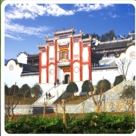
บ้านเกิดชิวหยวน