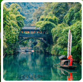
หมู่บ้านชาวนี้อีเจีย