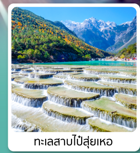
ทะเลสาบปี่สุ่ยเหอ