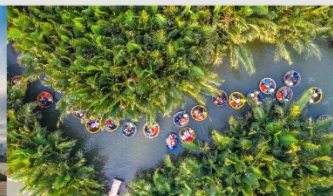
ล่องเรือกระดังง์

*กรณีห้องพัkbานาฮิลล์เต็ม ขอสงวนสิทธิ์ในการเปลี่ยนวันเข้าพัก และปรับเปลี่ยนโปรแกรมโดยคำนึงถึงผลประโยชน์ลูกค้าเป็นสำคัญ