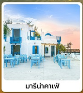
มารีนาคาเฟ่