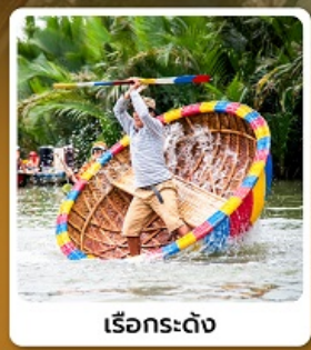
เรือกระดง