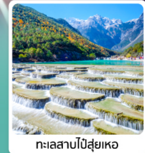
ทะเลสาบโป้สุ่ยเหอ