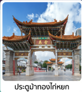
ประตูน้ำทองโก่หยก