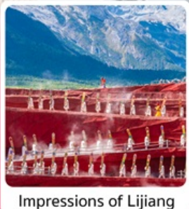
Impressions of Lijiang

ไฮไลต์ เที่ยวครบ คุนหมิง ต้าหลี่ ลี่เจียง แชงกรี่ล่า นั่งกระเช้าขึ้นภูเขาหินะมิงกรยอก ชมโชว์ "Impression of Lijiang"