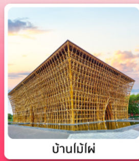
บ้านไม้ไผ่