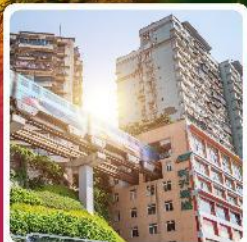
รถไฟฟ้ากะลุดึก