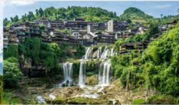
หมู่บ้านโบราณฝูหรงเจิ้น