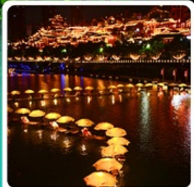
เมืองเซียนเิน