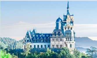
ปราสาทตามด้าว