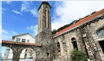
โบสถ์หินตามด้าว