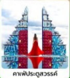
คาเฟ่ประตูสวรรค์