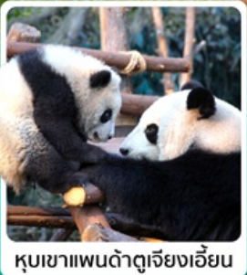
หุบเขาแพนด้าตู่เจียงเอี้ยน