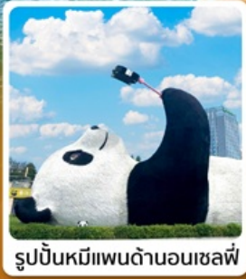
รูปปั้นหมีแพนด้าอนเซลฟ์