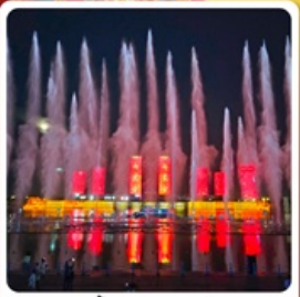
น้ำพุคังปาซี

• โอโหล้ เป็นทรายเสียงชาวนา แหล่งท่องเที่ยวระดับ 5A ของจีน ภูเขาไฟอุลันฮาตา น้ำพุคังปาซี น้ำพุที่สูงที่สุดในเอเชีย