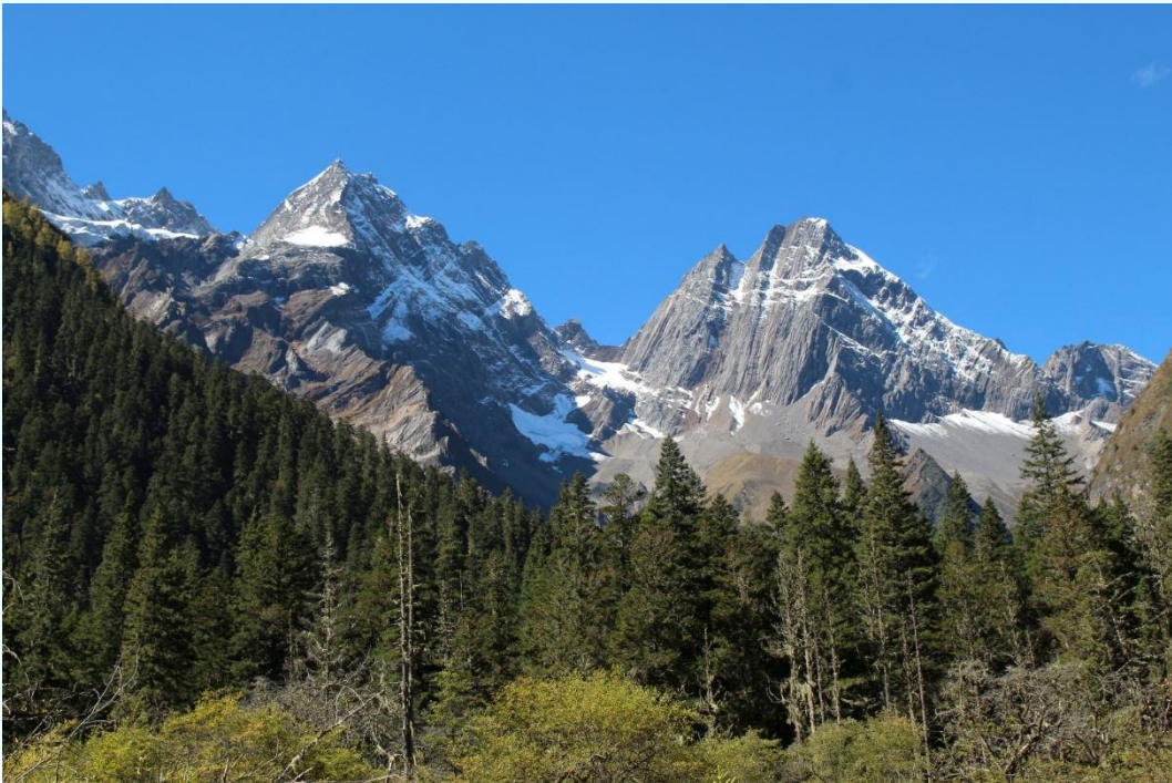
ฤดูใบไม้ผลิ (SPRING)