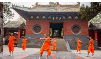
ชมโชว์กังฟูเส้าหลิน

*ทางบริษัทฯ ขอสงวนสิทธิ์ในการสลับโปรแกรมทัวร์ตามความเหมาะสมขึ้นอยู่กับสถานการณ์หน้างาน โดยคำนึงถึงผลประโยชน์ของลูกค้าเป็นสำคัญ