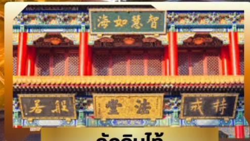
วัดจีนไท่