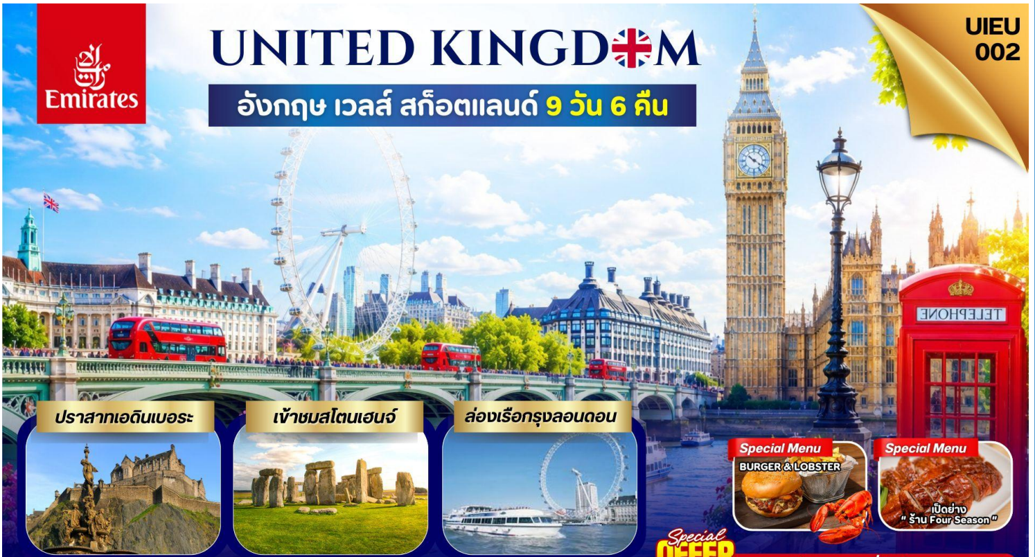
ปราสาทเอดินบะระ