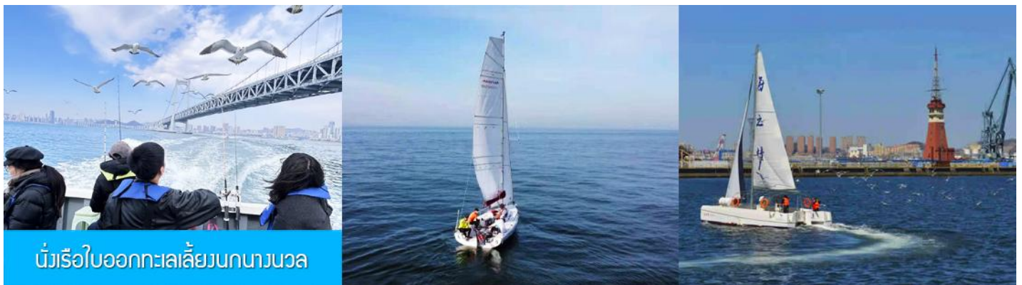
นั่งเรือใบออกทะเลเลี้ยงนกนางนวล