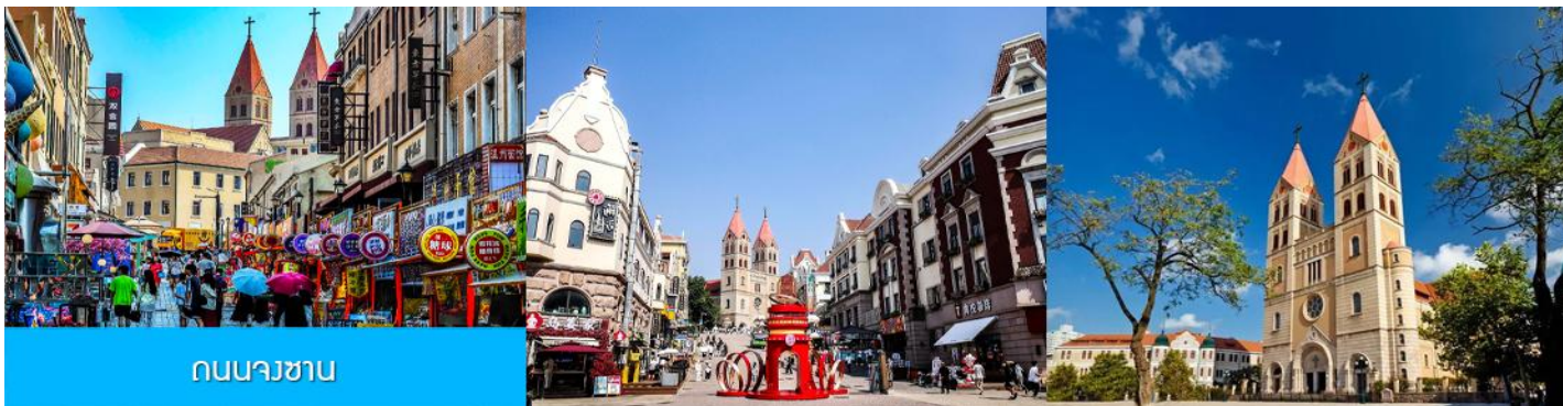
ถนนนางซาน