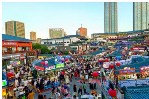
KOREAN TOWN หันเล่อฟาง