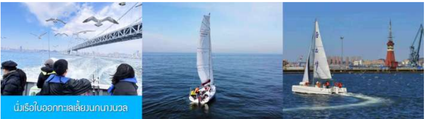
นั่งเรือใบออกทะเลลัดวงกนางนวล

ต่อด้วยนำท่านเที่ยวชมถนนรัสเซีย 俄罗斯风情街 ในอดีตที่นี่เป็นศูนย์ที่ตั้งของที่ทำการเมืองต้าเหลียน ภายหลังได้กลายเป็นชุมชนของพ่อค้าและวิศวกรทางรถไฟชาวรัสเซีย บริเวณนี้จึงเต็มไปด้วยอาคารบ้านเรือนแบบตะวันตก(รัสเซีย) มากมาย นอกจากนี้ได้เก็บภาพที่มีพื้นหลังเป็นอาคารสถาปัตยกรรมตะวันตก ที่นี้ยังมีร้านค้าที่จำหน่ายสินค้าและของที่ระลึกที่นำเข้ามาจากรัสเซีย อาทิ ช็อคโกแลต เหล้าวอดก้า ตุ๊กตารัสเซีย ฯลฯ