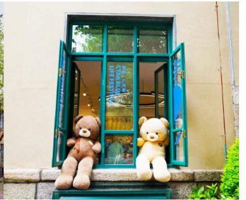
เมืองเก่าเยอรมัน ตรอกกว้างชิงลี่

จากนั้นเดินทางต่อ สู่ย่าน เมืองเก่าเยอรมัน ตรอกกว้างชิงลี่ 广兴里 ตรอกซอกซอยที่เรียงรายไปด้วยอาคารสถาปัตยกรรมแบบ ผสมผสานจีนและอาคารสไตล์ยุโรป