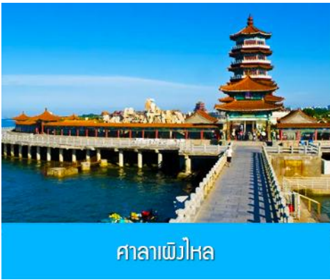
ศาลาพิงไห่