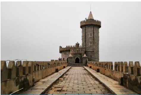
คาเฟ่อีสต