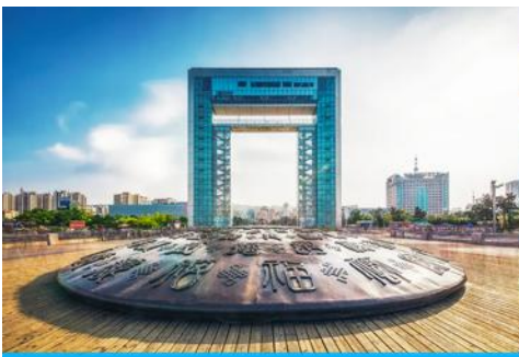
ประตูแห่งโชค