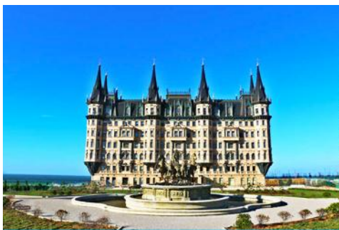
คฤหาสน์เหวินเจิง

นำท่านไปเยือนเมืองท่าสุดโรแมนติคสไตล์ยุโรป ท่าเรือชาวประมง ให้ท่านได้ชมสถาปัตยกรรมสไตล์อเมริกาเหนือ และ ยุโรป ที่ตั้งอยู่ในผืนแผ่นดินจีน ณ เมืองเยียนไถ เก็บบรรยากาศลมทะเล และเก็บรูปกับอาคารหลังคาสี่เหลี่ยมเป็นฉากหลัง ที่เต็มไปด้วยมนต์เสน่ห์และความทรงจำที่สวยงาม ให้ท่านเก็บภาพความสวย