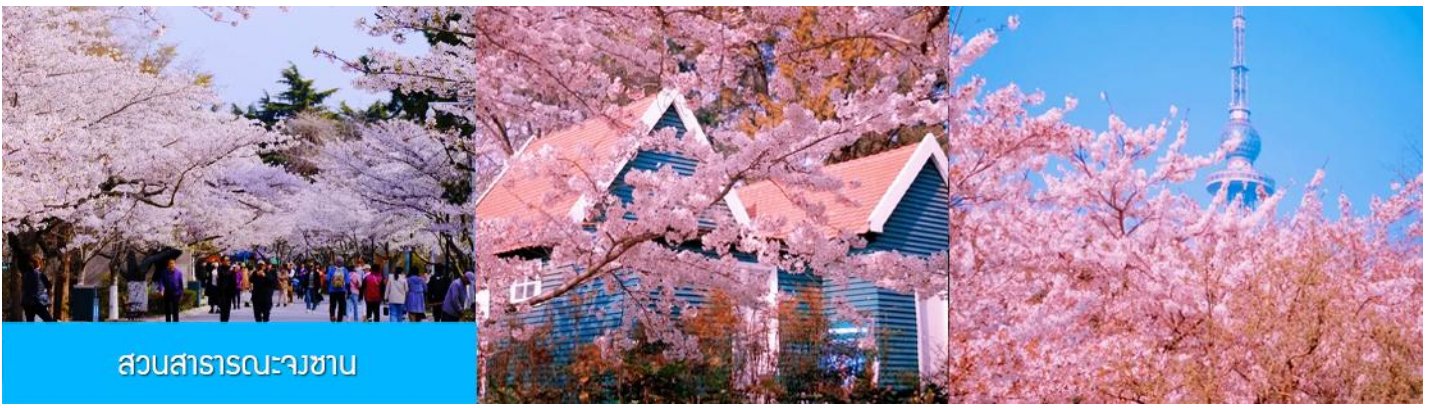
สวนสาธารณะจางซาน

ถึงชิงเต่า นำท่านชมสวนสาธารณะจางซาน สวนจางซาน ได้ขึ้นชื่อว่าเป็นสวนที่ชมซากุระสวยที่สุดในเมืองชิงเต่า พอถึงช่วงดอกบาน ต้นซากุระสองข้างทางจะผลิบานพร้อมกัน กลายเป็นอุโมงค์สีชมพูขาว เดินเข้าไปในสวน แล้วบรรยากาศคือหวานละมุน และดูโรแมนติก จะบานช่วงปลายมีนา ถึง ต้นพฤษภาคม