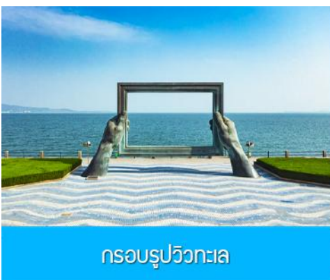
กรอบรูปวิวกทะเล

พักที่ Holiday Inn Express Hotel หรือ ระดับมาตรฐาน 4 ดาว ทั้งหมด