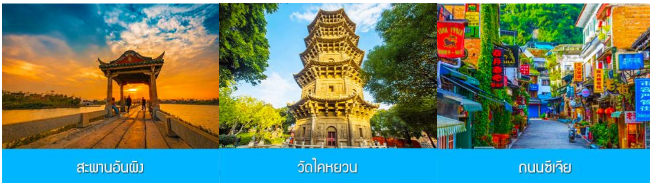
สะพานอันผิง