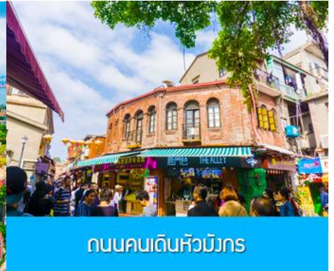
ถนนคนเดินหัวมังกร