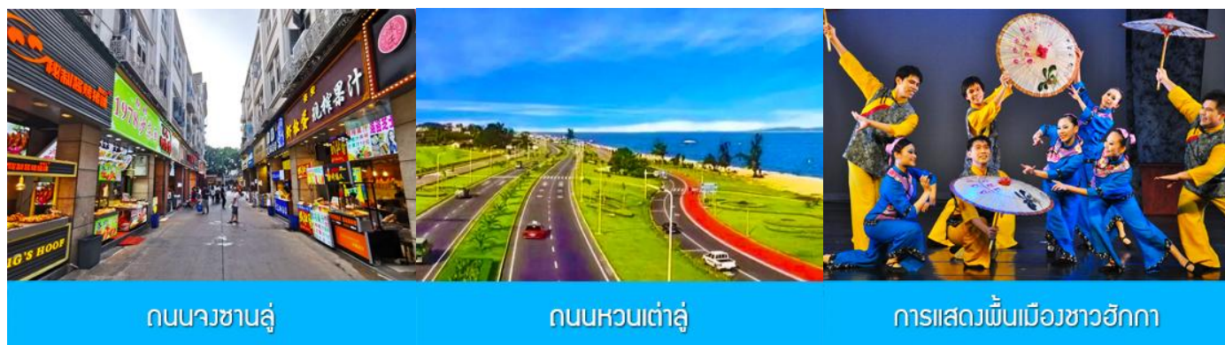
ถนนวซาลู่

พักที่ โรงแรม XIAMEN HENGLONG HOTEL 4* หรือเทียบเท่าในเมืองเซี่ยเหมิน